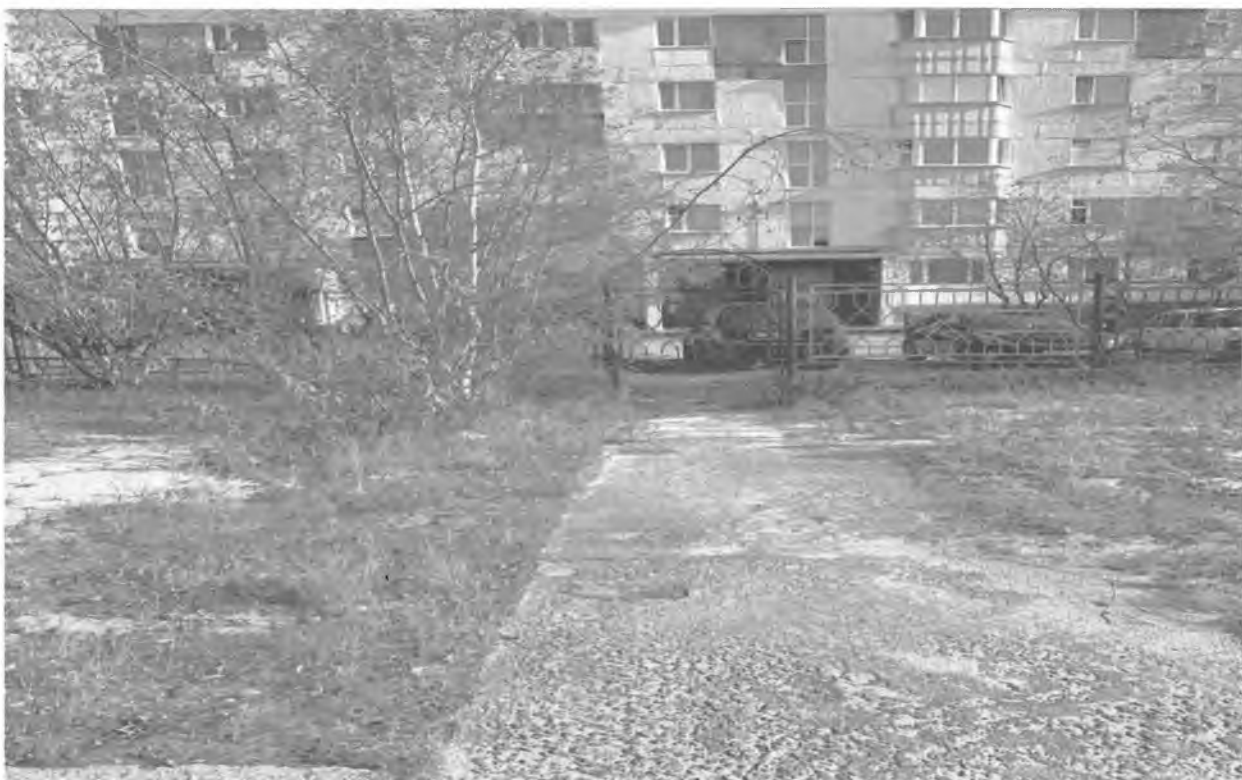
Вход на территорию детского сада «Руслан» с ул. Интернациональная