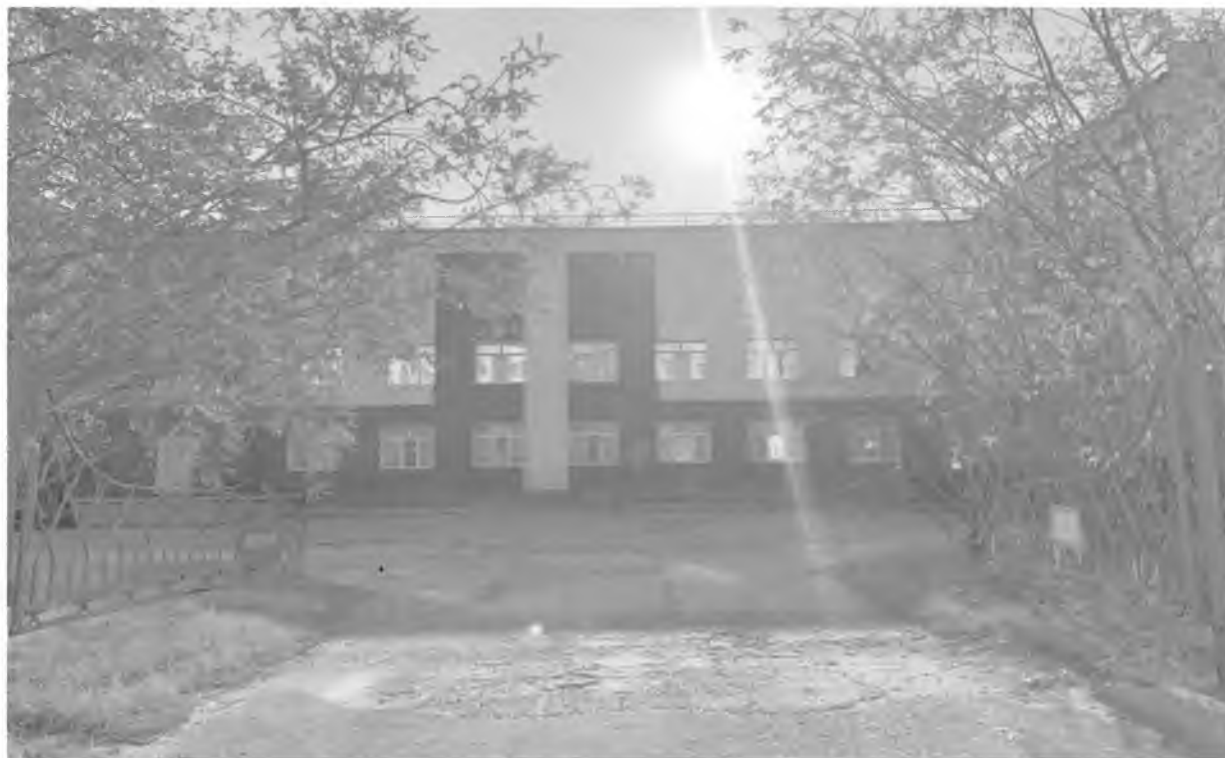
Левая сторона проезжей части дороги с ул.26 Съезда КПСС